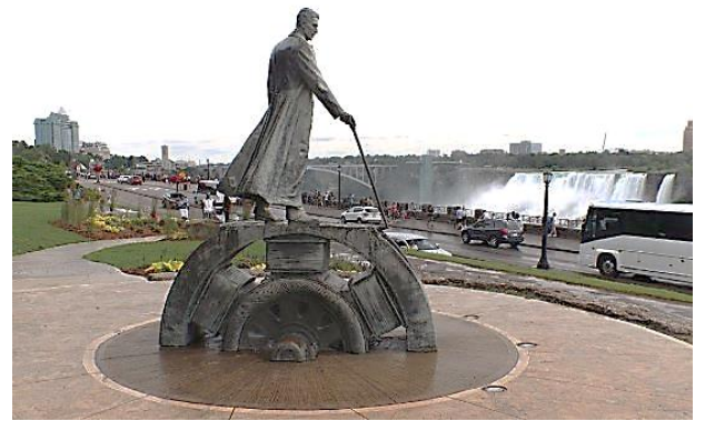
Photo : Statue de Nikola Tesla à Niagara Falls, ON

Avec Nikola Tesla pour qu'il me refille ses inventions, surtout celles de l'électricité sans fil !