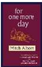
For one more day - Mitch Albom

C'est un livre sentimental qui vous fait apprécier votre maman ; il décrit l'amour inconditionnel d'une mère pour ses enfants. Je l'ai lu tellement de fois. Ça me fait pleurer comme un bébé à chaque fois.