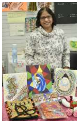
* Rani Laxmibai.

Q. Héros dans votre jeunesse? Aujourd'hui?