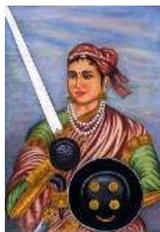
dans ma jeunesse.

C'était une grande guerrière et une reine qui s'est battue et a donné sa vie pour l'indépendance de son peuple contre l'Empire britannique.