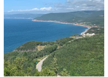
Sentier Cabot au Cape Breton en N.-É., et

Il se peut que je ne l'ai pas encore fait. Mais, jusqu'à date deux sont à égalité en première place pour moi : le