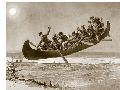
La Chasse-galerie - Henri Julien, 1906, Musée national des beaux-arts du Québec

La Chasse-galerie aussi connue sous le nom de « The Bewitched Canoe » ou « The Flying Canoe » est un conte canadien-français populaire de Coureurs des bois qui font un marché avec le diable, une variante de la chasse sauvage. Sa version la plus connue a été écrite par Honoré Beaugrand (1848-1906). Il a été publié dans The Century Magazine en août 1892. - Source Wikipédia